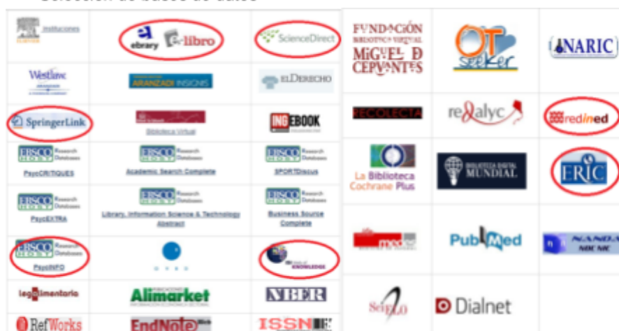
Imagen 1 Selección de bases de datos

Nota. Adaptado de captura de pantalla de distintas bases de datos.