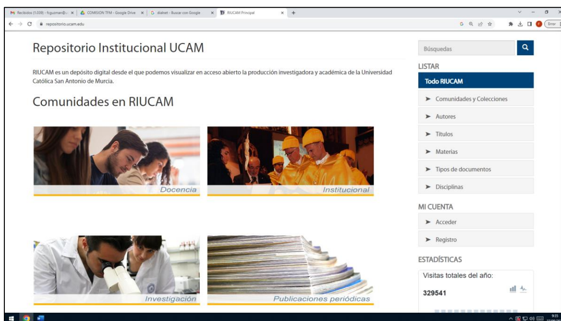
Figura 7. Página de inicio de RIUCAM

Debemos acceder a la página web de RIUCAM ( https://repositorio.ucam.edu/ ) y utilizar los filtros de búsqueda situados en el margen superior izquierdo (Todo RIUCAM):