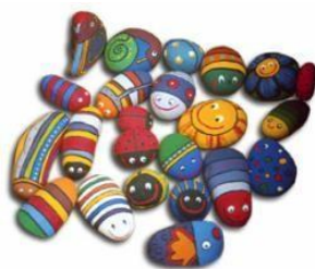
Figura 10. Resultado de la actividad “Trabajamos la creatividad”.

Ej.: La Figura 1 muestra un ejemplo de cómo podría resultar la actividad “Trabajamos la creatividad”.