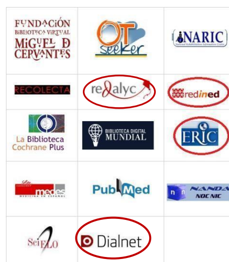
Figura 2. Bases de datos de acceso libre