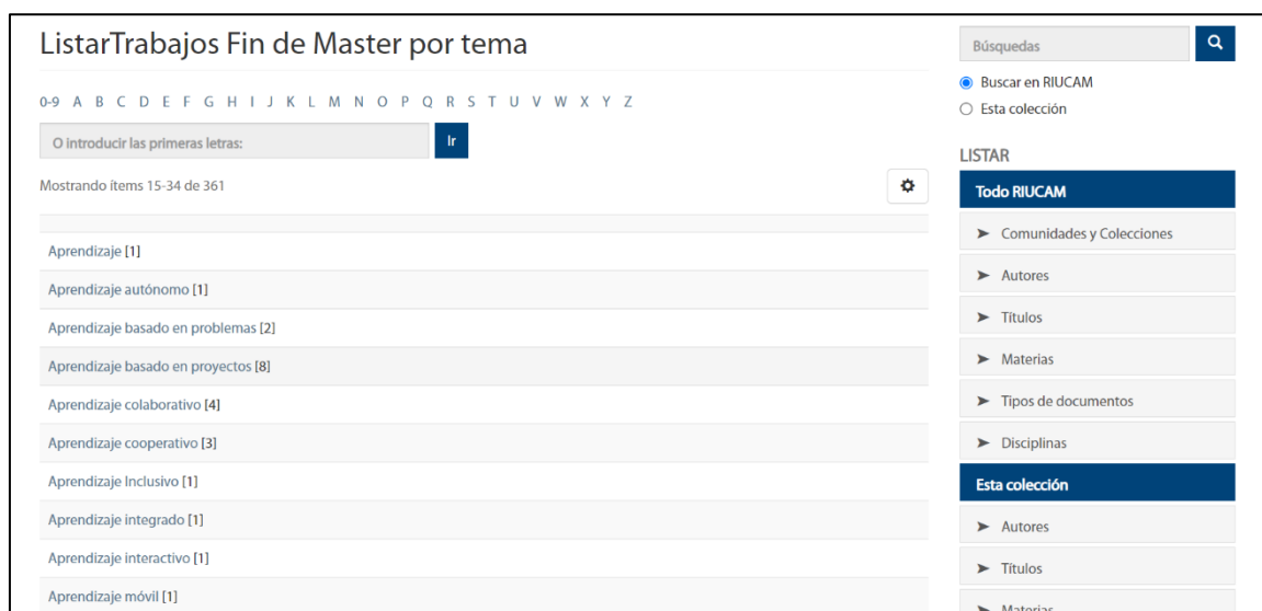
Figura 8. Motor de búsqueda RIUCAM