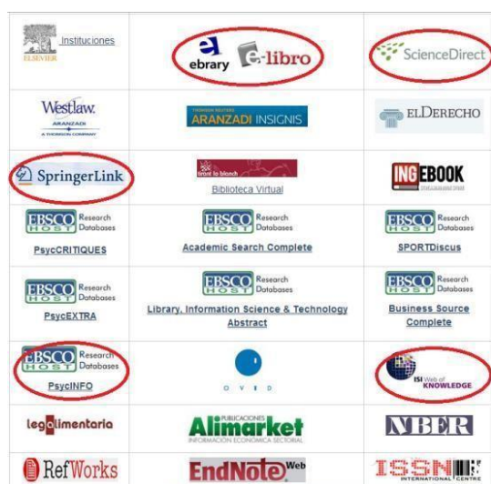
Figura 1. Bases de datos acceso UCAM

Aunque existen muchas formas de localizar literatura, las bases de datos electrónicas son una forma sencilla y cómoda. La UCAM pone a nuestra disposición bases de datos electrónicas tanto de acceso libre como de acceso restringido (sólo accesibles dentro de la UCAM). Podemos encontrarlas en la página web de la Biblioteca Digital 1 . En las Figuras 1 y 2 aparecen rodeadas con un círculo las bases de datos 2 más útiles para el área de Educación que se encuentran en la página de la Biblioteca Digital de la UCAM.