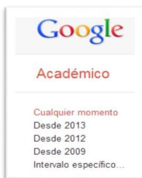
Figura 4. Delimitar la fecha de Búsqueda.

Como se observa en la Figura 3 la salida arroja documentos que contienen las tres palabras. Es importante tener en cuenta que las tres palabras pueden aparecer en cualquier parte del documento (título, resumen, cuerpo del texto, etc.). Veremos la manera de cambiar esta opción más adelante si queremos, por ejemplo, que las palabras aparezcan obligatoriamente el título del documento. Otras utilidades de esta base de datos que pueden ser de gran ayuda se muestran en las Figuras 4 y 5.