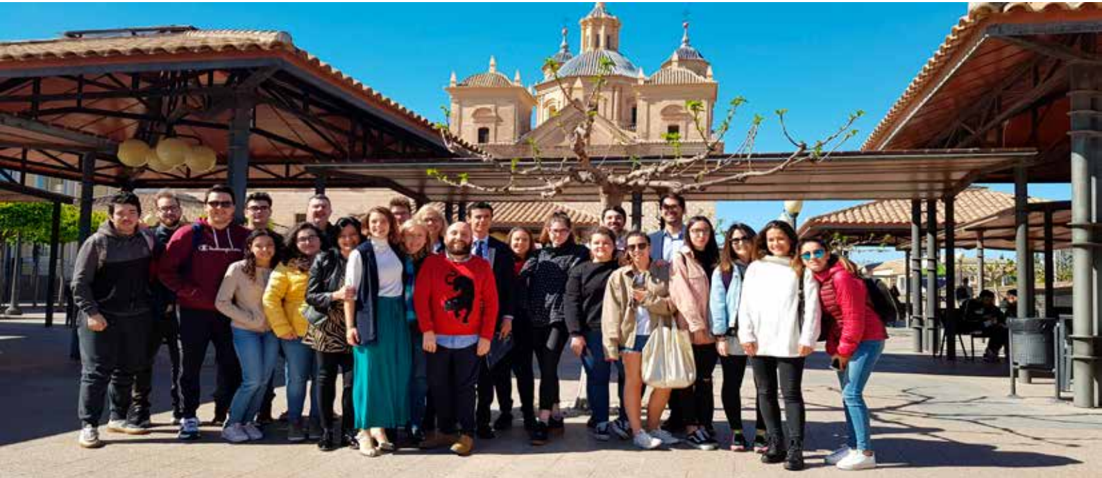
> Fotografía tomada durante uno de los Job Coffee de este año