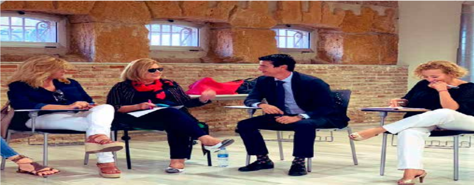
> Encuentro coworking organizado por Anaede