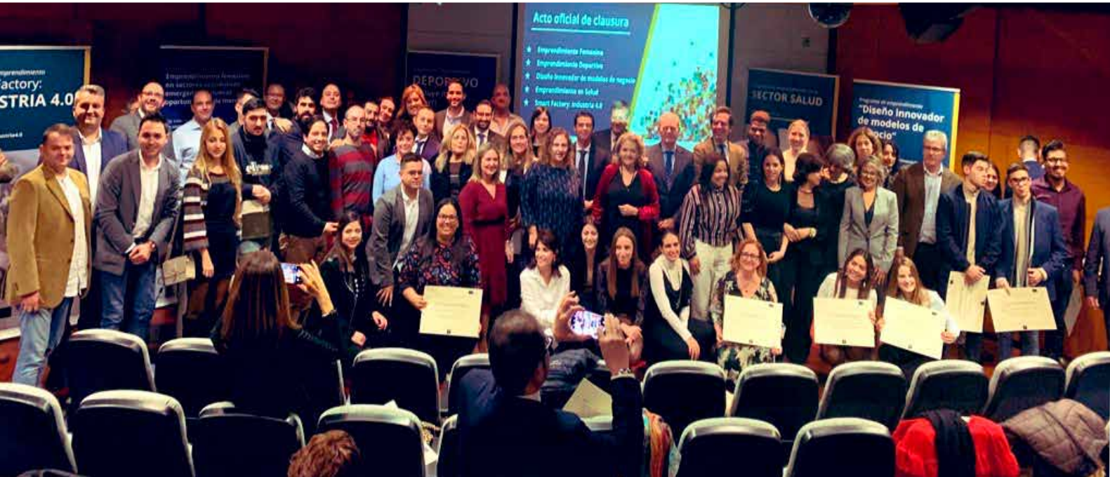
> Grupo de alumnos de los cursos de emprendimiento asistentes al acto de clausura