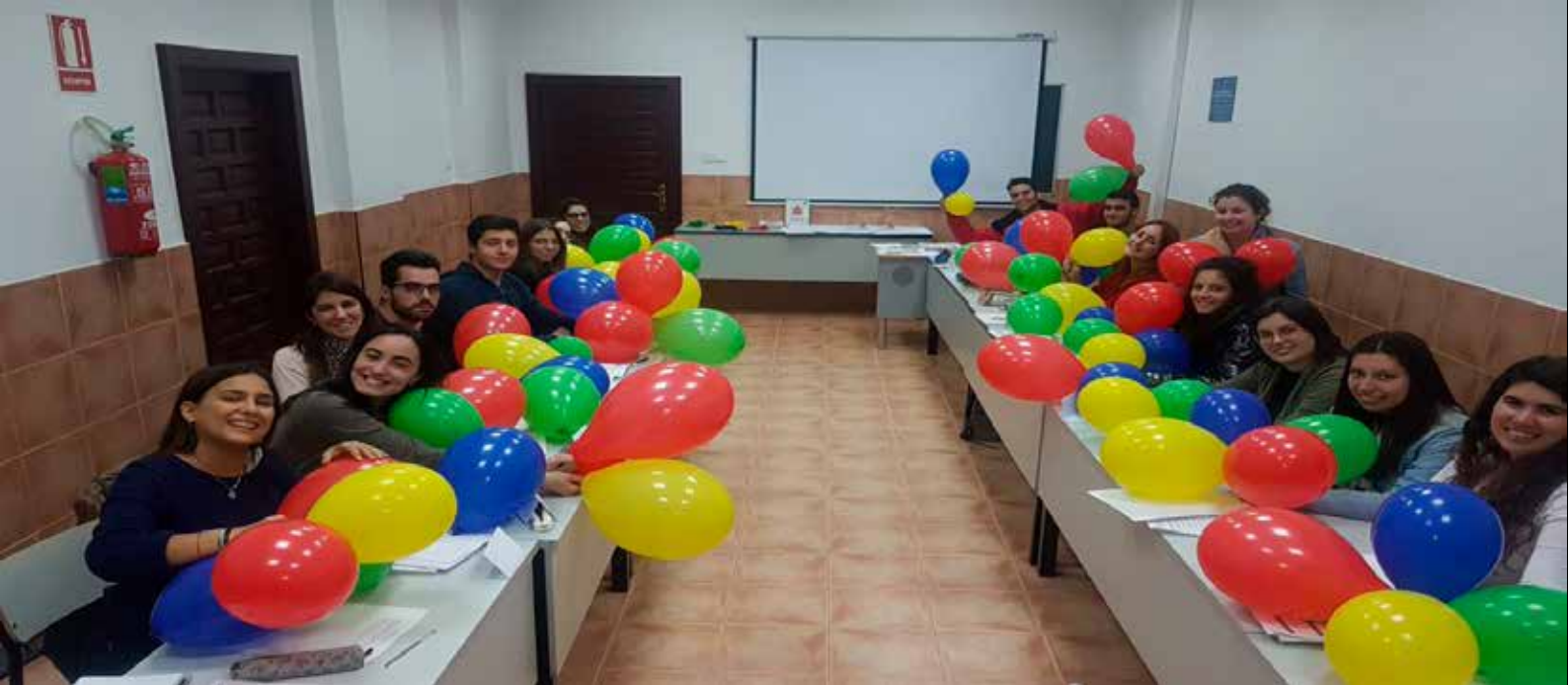
> Fotografía tomada durante una de las dinámicas de Viaje al Talento