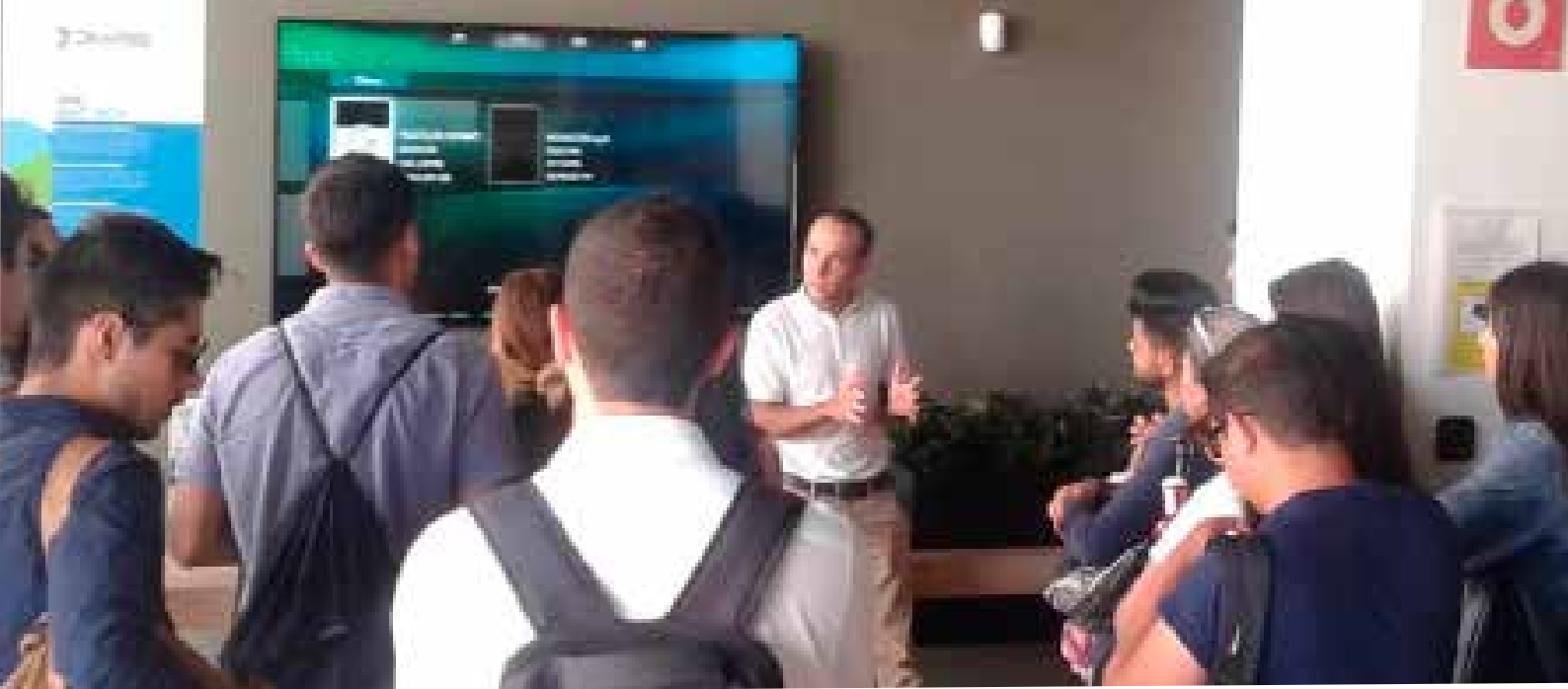
> Imagen realizada durante la visita a Dinapsis