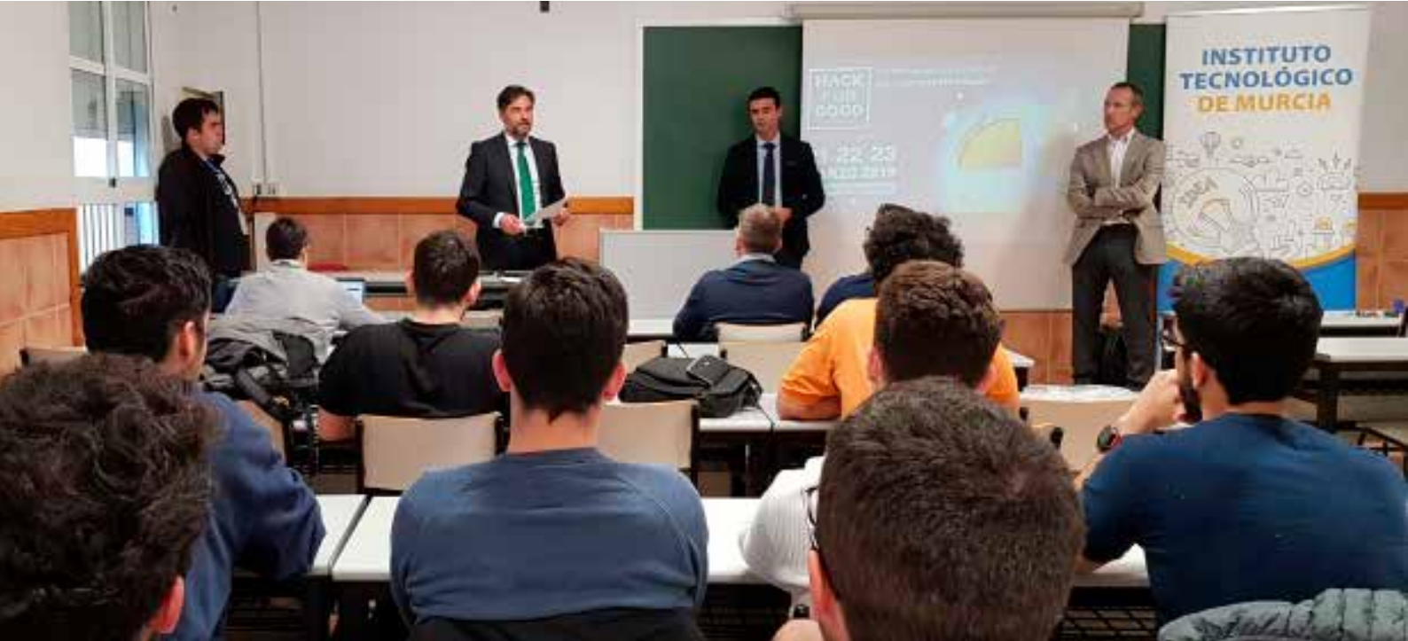
> Fotografía tomada durante la presentación del Hackathon