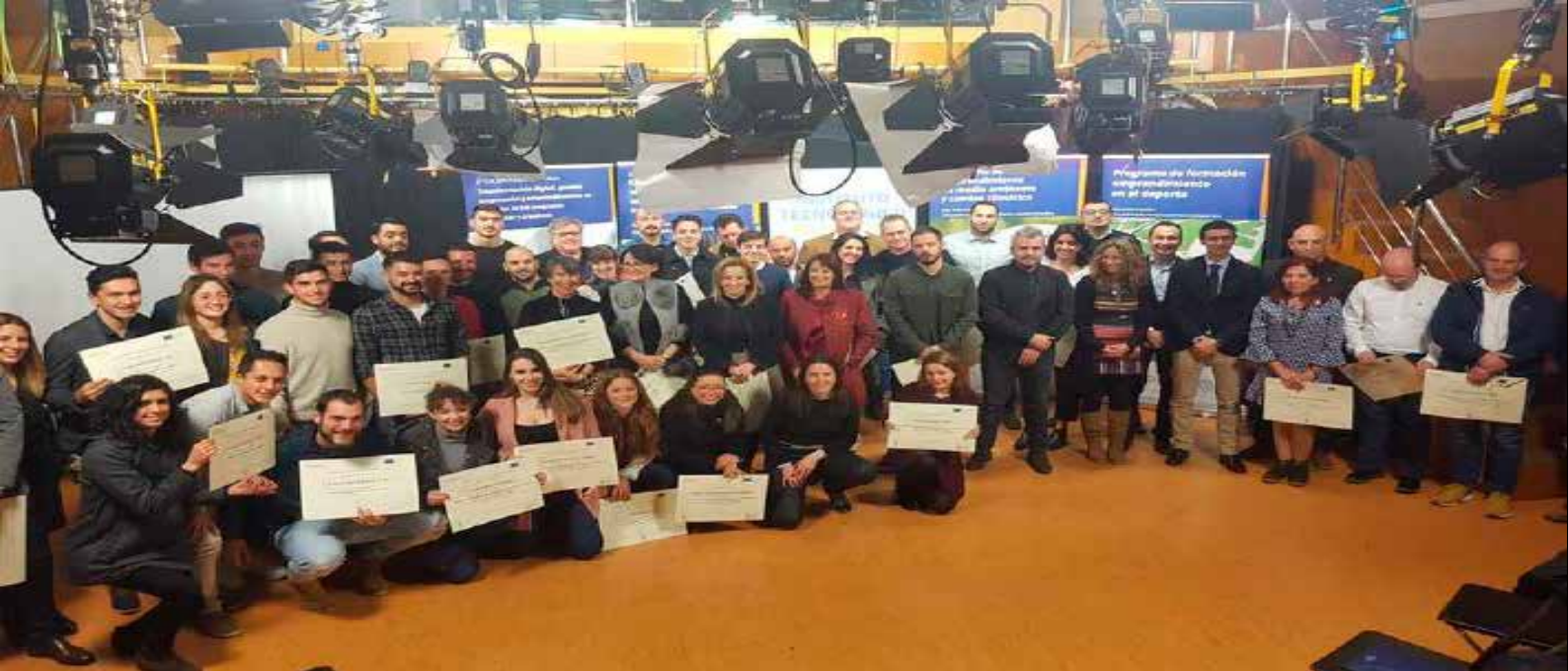
> Imagen de familia I finalizar la jornada de clausura