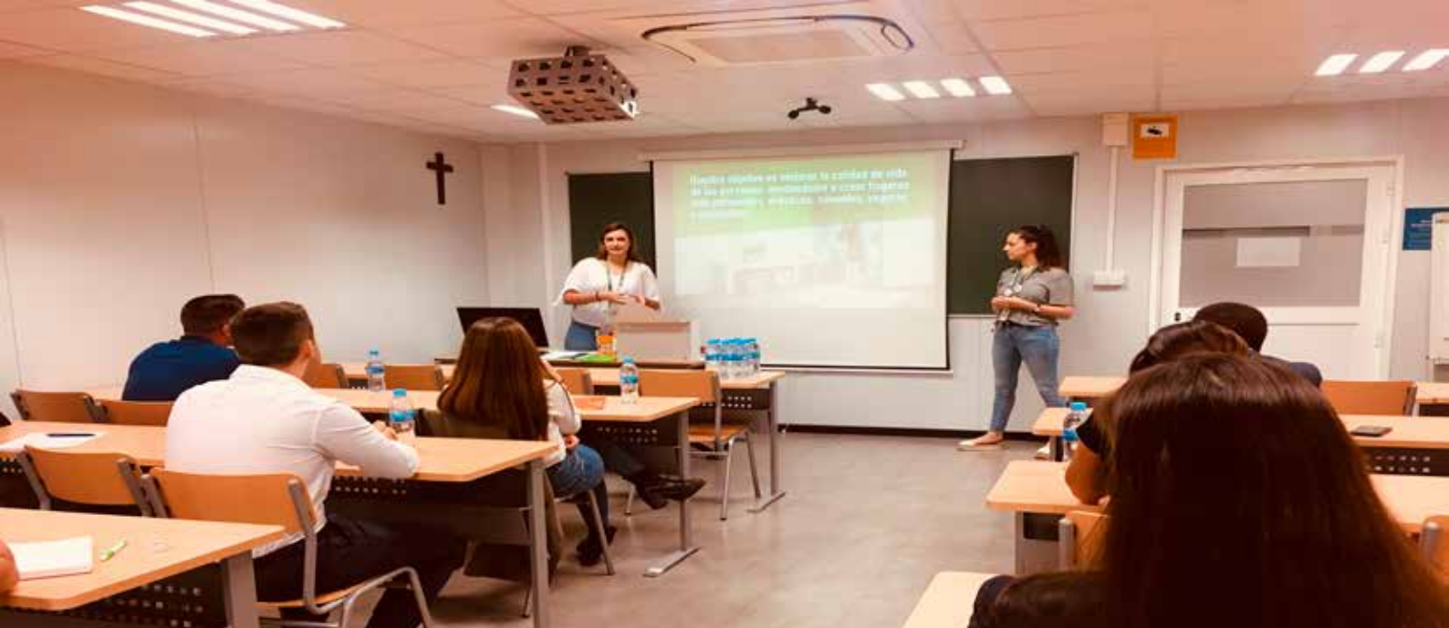
> Fotografía tomada durante el desarrollo de la primera fase del proceso de selección