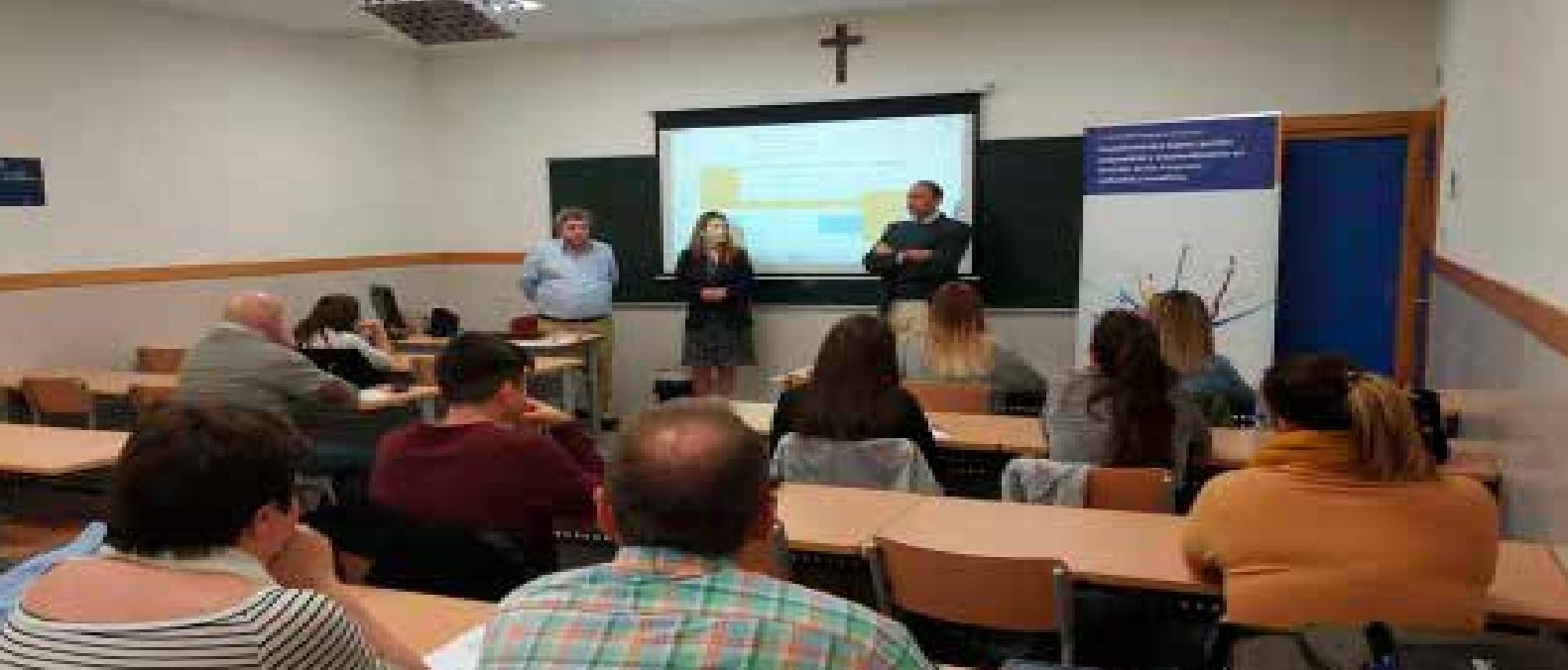
> Imagen tomada durante una de las clases conjuntas de Dicultura