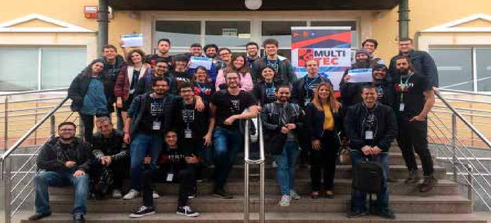
> Foto de familia con los ganadores y participantes de la edición Hack For Good celebrada en la UCAM