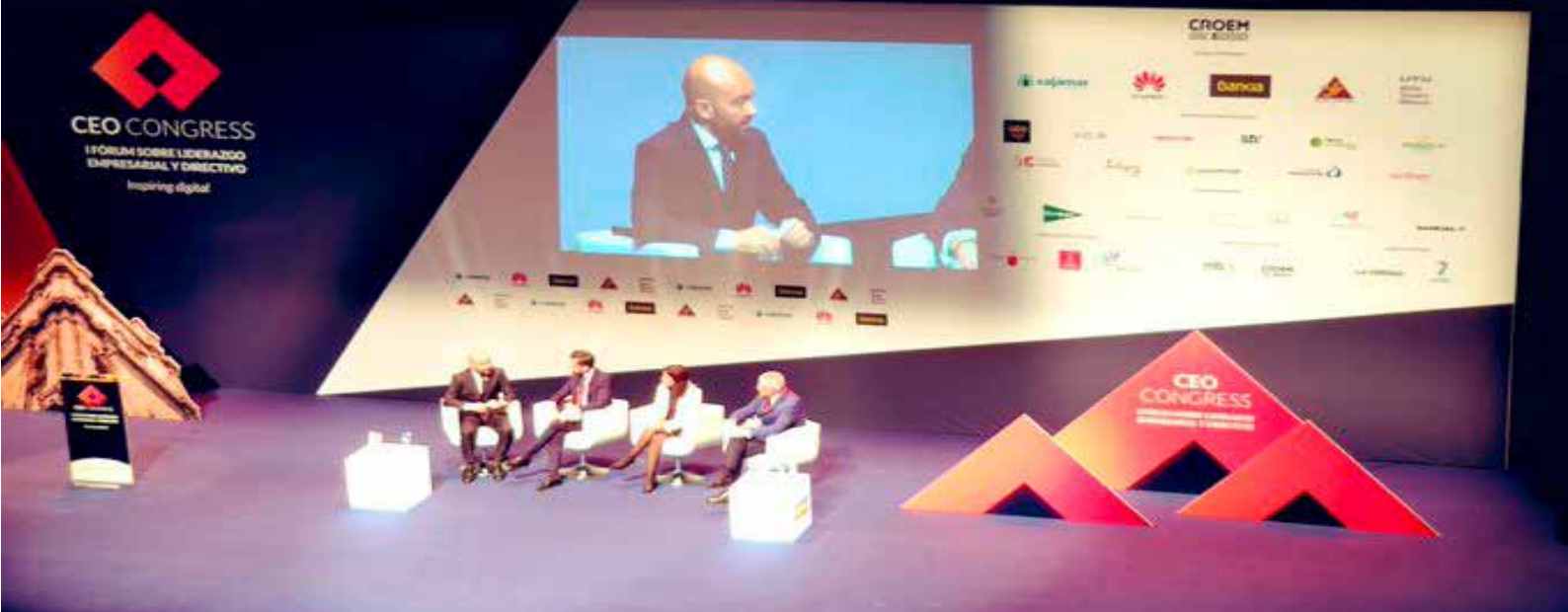
> Mesa redonda Ceo Congress