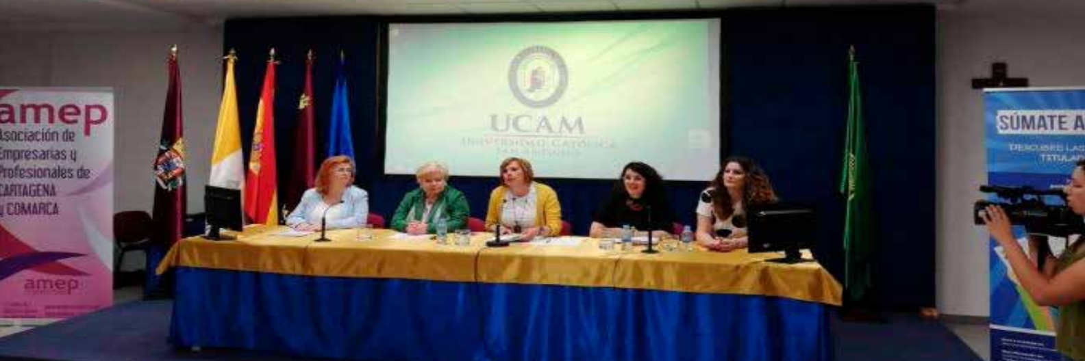
> Imagen de una de las sesiones del Job Day en el Campus de Cartagena