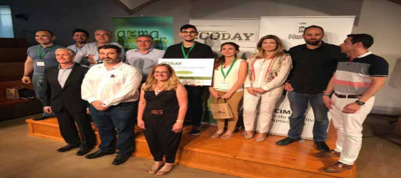
> Foto de familia tras la entrega del premio al proyecto ganador