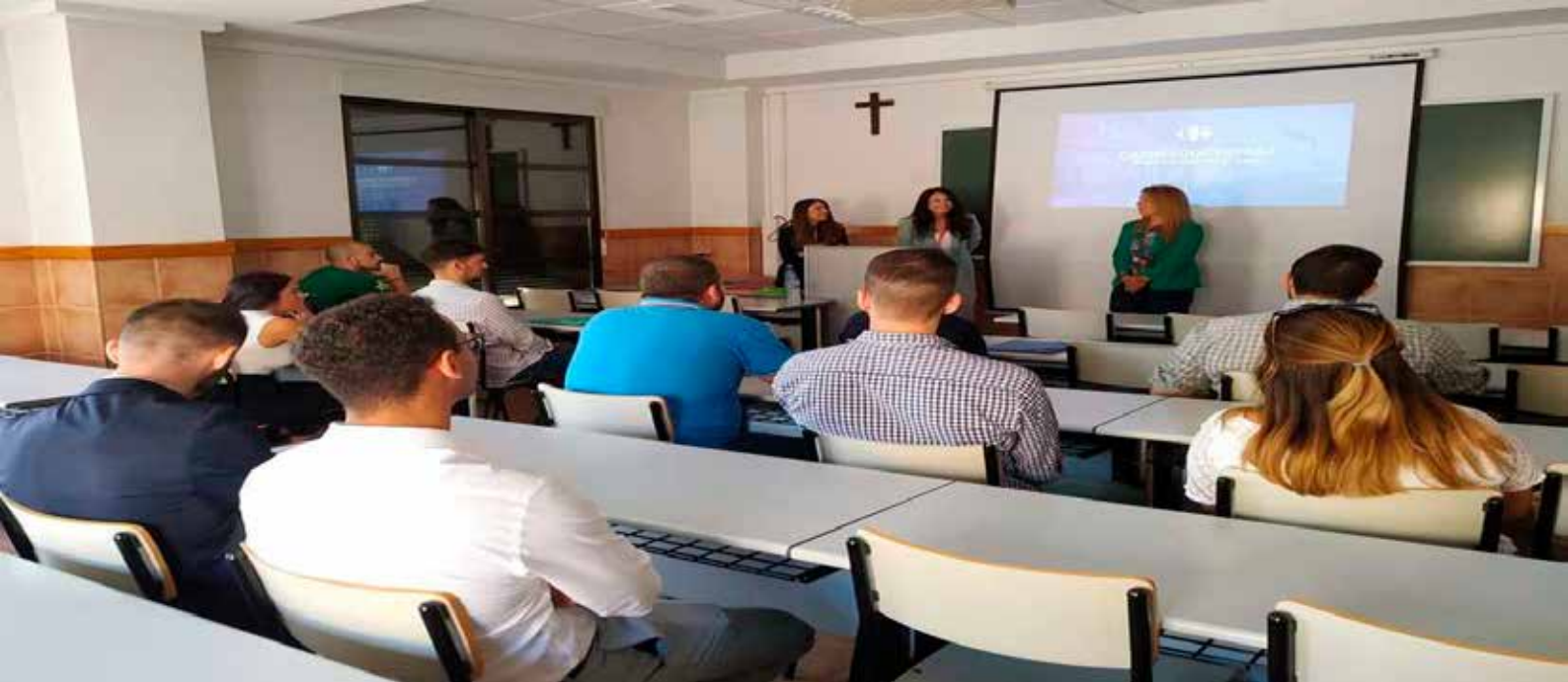
> Fotografía tomada durante el desarrollo del proceso de selección