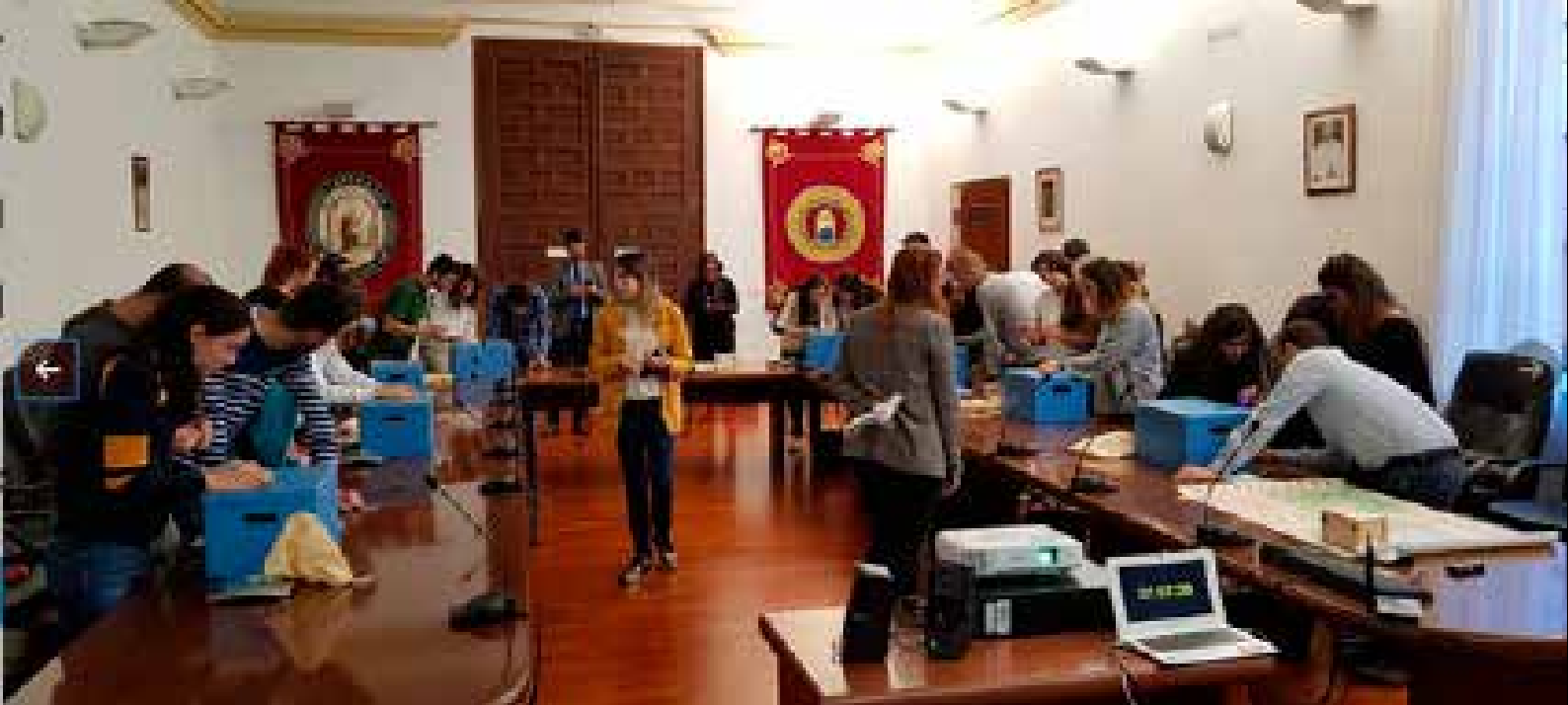
> Fotografía de grupo tomada después de la dinámica The Box Game