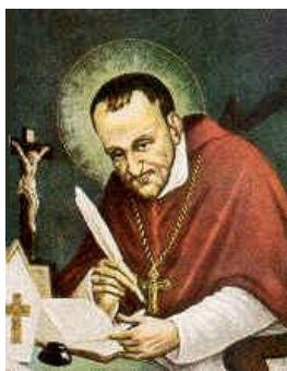
San Alfonso M a de Ligorio