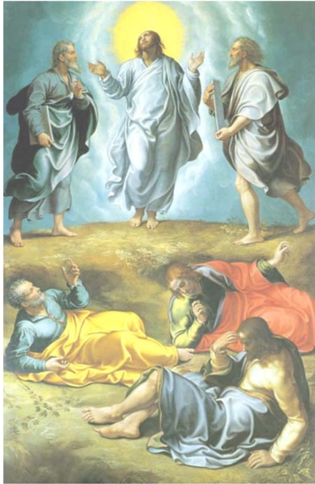
Girolamo da Sermoneta, La Trasfigurazione, 1556