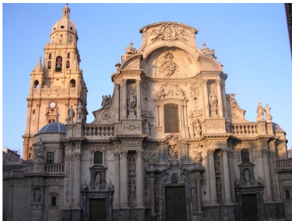
Ilustración 3. Catedral de Murcia